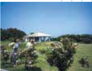
亜熱帯の花々が咲く島