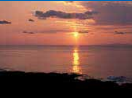
東シナ海に沈む夕日が美しい