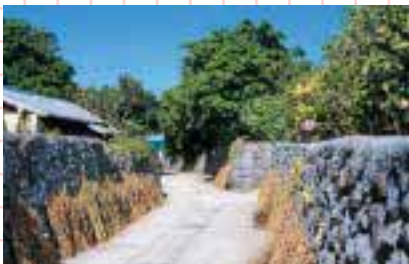
日本一の生産量の白ゴマが並ぶサンゴの石垣