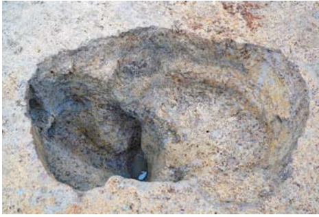
土坑 (長径約0.7m×深さ約1m)