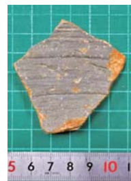
徳之島産カムイヤキ