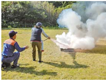
消火器の使用訓練の様子

通算第5号 喜界町埋蔵文化財センター発行 喜界町滝川1203 0997(55)3308