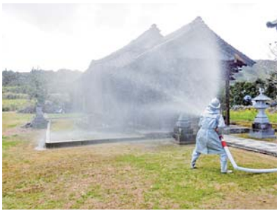
小野津消防分団による放水の様子