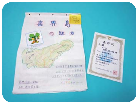
※作品のコピーを埋文センターに展示しています。

よる初期消火を行った。また、小野津消防分団と喜界消防分署による放水と重要文化財の搬出も行われた。その後、集落住民による消火器の使用訓練、消防署員と文化財保護審議委員による講話も行われた。 参加した住民は、「島の文化財について普段意識せず知らなかったが、大事にして伝えていく必要を感じた」と語っていた。 町内には、国・県・町指定の文化財や島独自の伝統文化が多数存在する。この機会に身近にある国民共有の「財産」である「文化財」について考えてみてはいかがでしょうか。