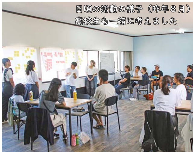
目頃の活動の様子(昨年8月) 高校生も一緒に考えました

これは、奄美群島広域事務組合の「奄美群島の宝を次世代につなぐ助成事業」を活用したもので、HOWBE事務所(旧朝花)を発売し高校までと、ショッピングセンターふくりまでの2つに分かれ、沿道のゴミ拾いを行った。