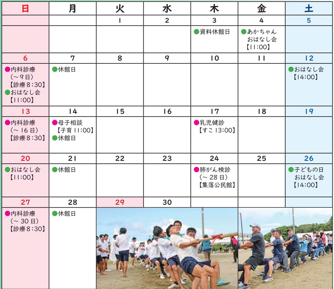
9月30日 高校体育大会時の写真 3年生 対 先生や保護者たち

すこ...旧すこやかセンター 子育...子育て支援センター コミ...役場コミュニティホール トレ...役場トレーニング室 研修...役場研修室 診療...診療所