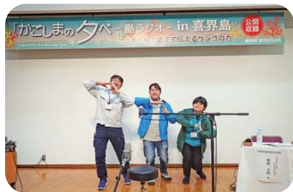
ラジオの公開収録で段丘ポーズ

さらにオンライン配信もあり、島外の友人たちから「ジオパーク認定、頑張れ!」「ジオパーク給食、気になる!」「シティガール…?」など、多くの感想が届きました。島の外からも応援されていることを実感し、改めてジオパーク認定に向けて頑張ろうと思いました。