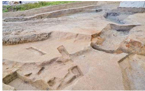
溝状遺構 (自然流路?) (幅約1m×深さ約1m)

町教育委員会は、昨年11月から旧志戸桶小学校に隣接する「キシ下遺跡」の発掘調査を進めている。