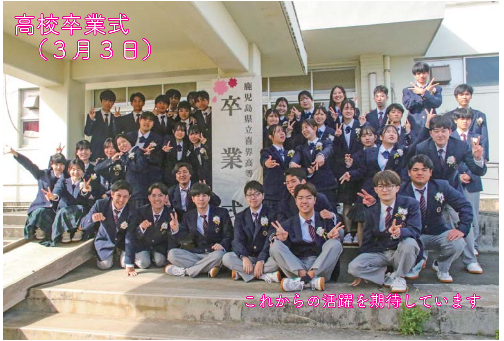
これからの活躍を期待しています