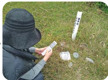
今年も家族が年末年始に遊びに来てくれました(母です)

そして、私自身は地域おこし協力隊の中で最も長く活動する立場となります。残り1年の任期の中で、喜界町の日本ジオパーク認定に向けて全力を尽くします。先輩方、本当にお疲れ様でした!これからもよろしくお願ひします!(ワタクシのお世話もお願いします)