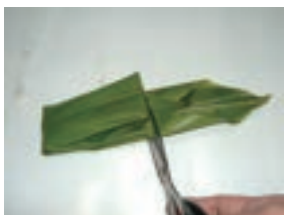
余分を切って出来上がり