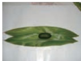
※細い葉は2枚重ねて包む