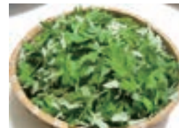
仕分けた生のヨモギ 300g

◇ヨモギの絞り汁は少し取り置き、「作り方②」で生地が硬いときの調整に使う。生地が軟らかいときは、もち米粉を足す。