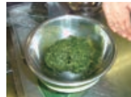
軟らかくゆでて絞って300g