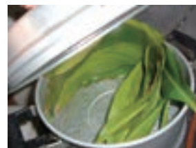
※採り立ての葉は軽く蒸すと包みやすい