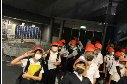
【鹿児島市立科学館】

5月31日（火）～6月3日（金）の期間で5・6年生が修学旅行に行ってきました。修学旅行の中で、多くの施設を見学してたくさんのお話を学ぶとともに、集団行動のきまりや公共施設でのマナーなどについても学ぶことができました。また、たくさんのおいしい思い出ができたようです。