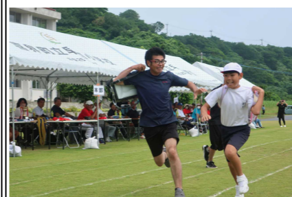
6年家族競技「その背中に夢をのせて！」