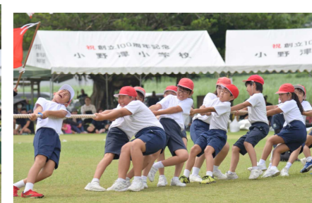
全児童「赤白対抗綱引き」