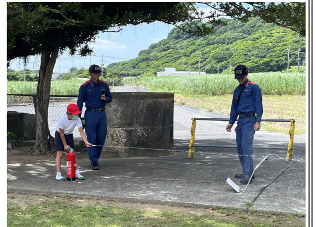
【代表児童による消火訓練】

10月6日(木)には、避難訓練を実施しました。今回は、地震発生後、理科室から出火するという想定での訓練でした。子どもたちは「お(押さない)・か(駆けない)・し(しゃべらない)・も(戻らない)・ち(近づかない)」の合言葉を意識しながら真剣に訓練に参加していました。また、代表児童が水消火器を使った消火訓練も行いました。地震や火災に限らず、災害はいつ起こるか分かりません。いざというときに、適切な対応ができるよう、家庭や地域でも準備をしておきたいものです。