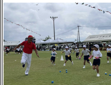
下学年学年種目「動く玉入れ」