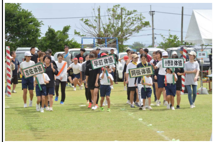
「地区体協混成リレー」