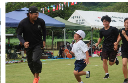
地域種目「家族でよ～いドン」