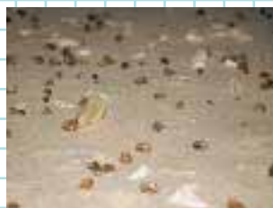
6~8月の大潮の夜には オカヤドカリの集団産卵が見られる 神秘的な砂浜