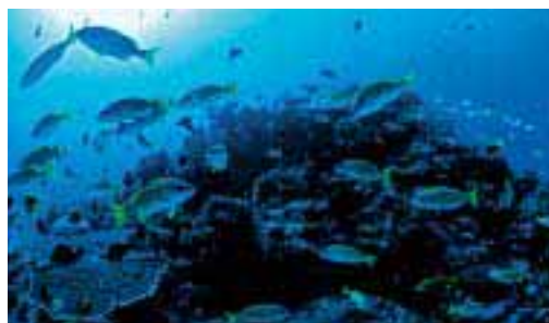
珊瑚礁の海には、ダイバーや釣り人が訪れる