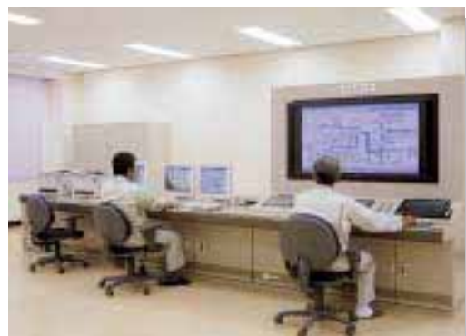
集中管理システム