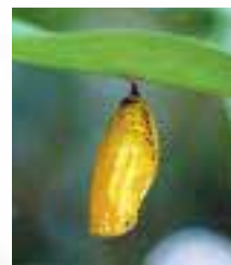
「オオゴマダラ」のサナギ