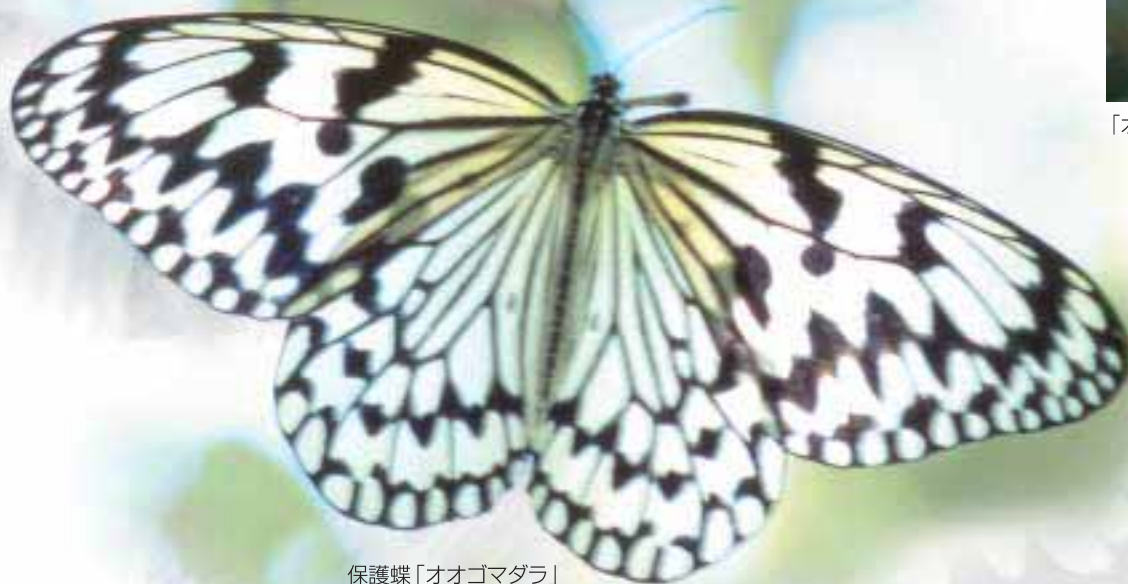
保護蝶「オオゴマダラ」