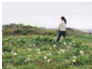
荒木海岸にはゆりが自生する