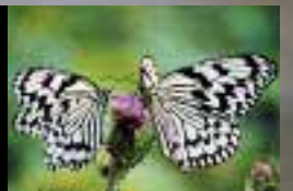
保護蝶「オオゴマダラ」