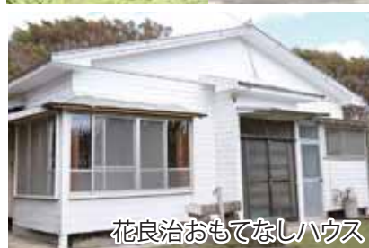
花良治おもてなしハウス