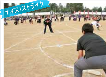
ナイス!ストライク