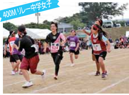
400M リレー 中学女子