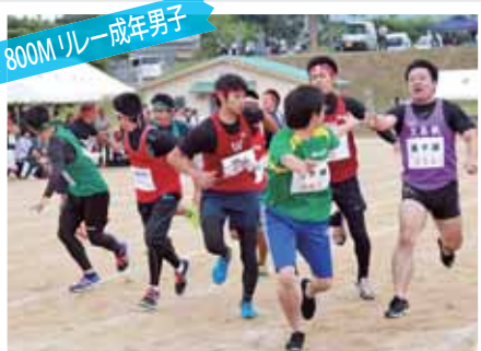
800M リレー 成年男子