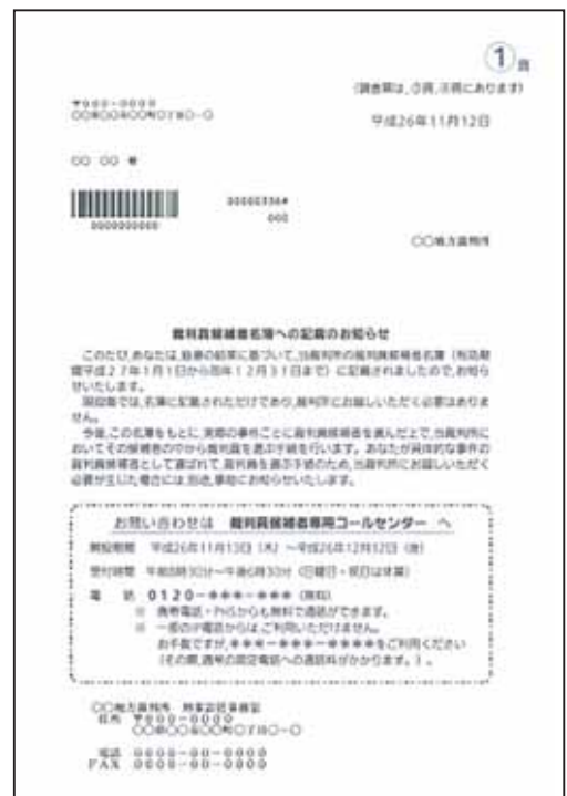
名簿記載通知（平成26年11月送付分）

名簿に登録された方には、本年11月中旬に名簿に登録されたことのお知らせ（名簿記載通知）をお送りします。