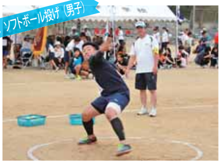
ソフトボール投げ(男子)