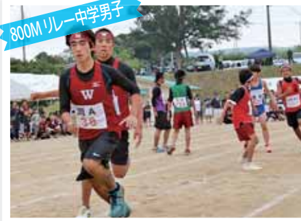
800M リレー 中学男子