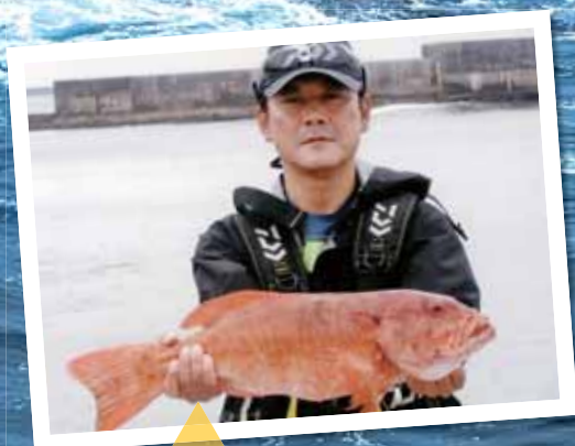
ハージン (スジアラ) 漁場: 早町港、2.7kg

連載は不定期で、投稿者全ての写真を掲載できるわけでは ありませんので御了承ください。