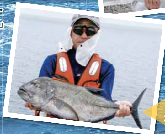
カスミアジ 漁場: 早町港、6.8kg