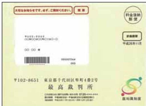
名簿記載通知の発送用封筒（平成26年11月送付分）