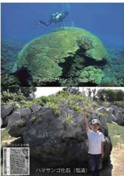
ハマサンゴ化石（想像）