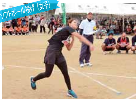
ソフトボール投げ(女子)