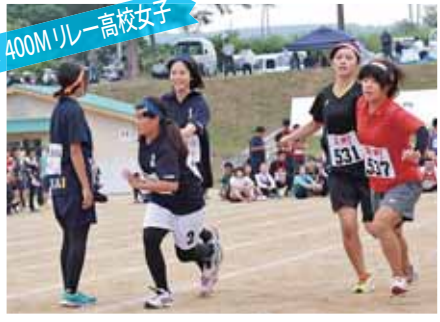
400M リレー 高校女子