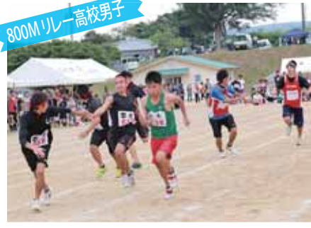
800M リレー 高校男子