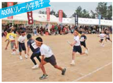
400M リレー 小学男子