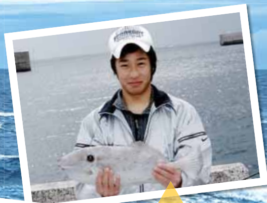
カワハギ (ウスバハギ) 漁場: 早町港、2.2kg

必要な情報は、「釣った方の氏名・年齢」、「釣った場所」、「日時」、「魚名」などを提供して頂きます。