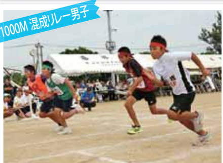
1000M 混成リレー 男子