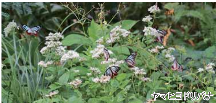
ヤマヒヨドリバナ

▲アサギマダラロードに咲くヤマヒヨドリバナ。この花は、低地 から山地のやや日当たりのよい路傍や林縁に生える多年生草 本。高さは30~100cmほどで、花は白色または帯淡紅色。 この花に約1000kmをも旅をする多くのアサギマダラが吸蜜し ていた。ヒヨドリバナの花言葉は「清楚、期待、延期」