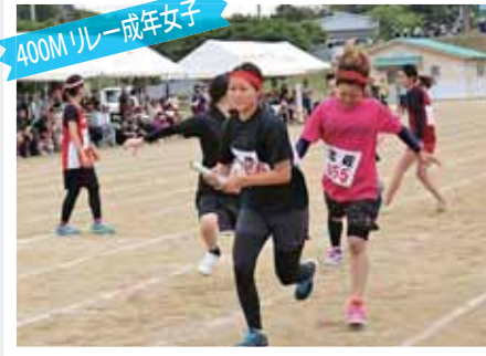
400M リレー 成年女子