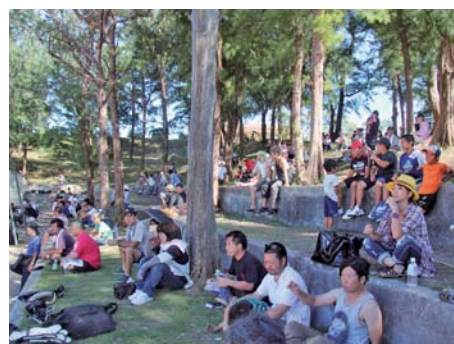
たくさんの応援が駆けつけた