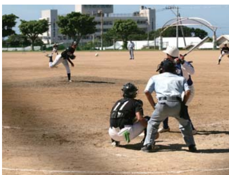
決勝を戦う喜界チーム