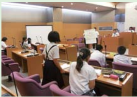
子ども議会の様子