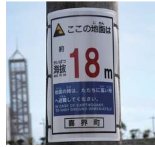
中学校門前に設置された表示板

役場総務課は津波対策の一環として、集落内や公共施設、集落の公民館など118カ所に海拔表示板を設置した。この表示板は東日本大震災以後、防災意識の高揚により全国的に設置が進められている。表示板は縦約45センチ、幅約30センチ。海拔2メートルの沿岸付近から滝川集落の海拔104メートルで設置。