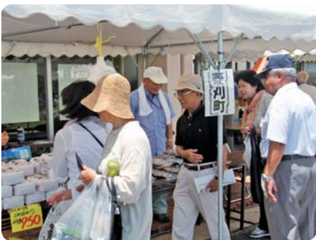
姉妹都市 菱刈町も出店