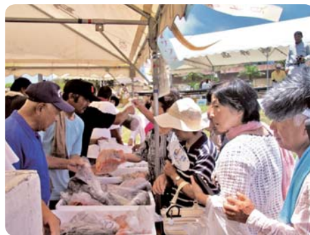
今年も好評、漁協の即売会