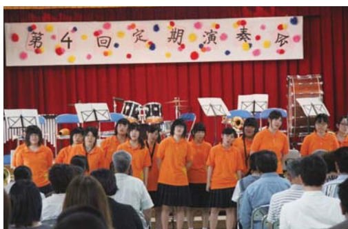
生徒らの合唱も披露された

喜高吹奏楽部は、今年1年生5人を迎え、14人で活動。昨年は第56回鹿児島県吹奏楽コンクールにおいて金賞を受賞し、南九州大会に出場した。