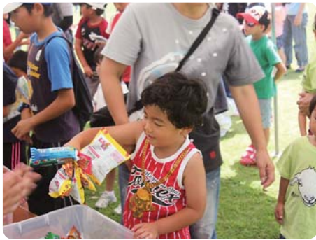
たくさんとれたよー!!