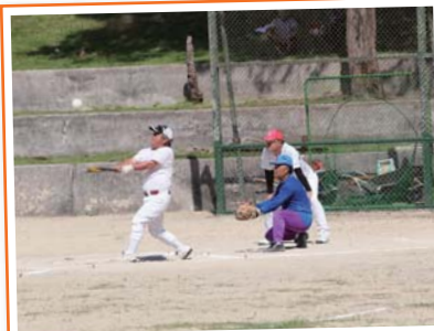
攻守で活躍、浦原集落叶投手