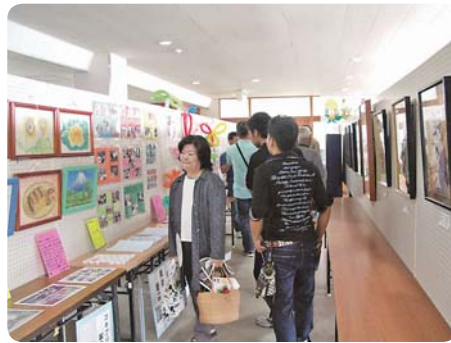
ロビーに展示された各種団体の作品