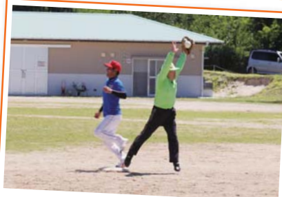
後ろに逃さずキャッチ!!