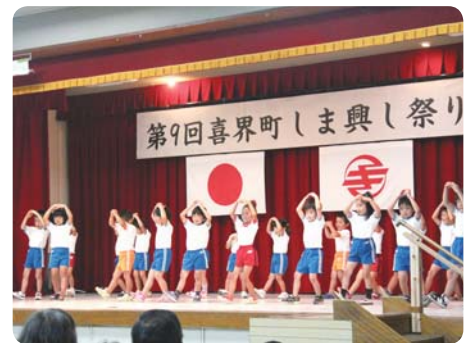
微笑ましい園児達のダンス