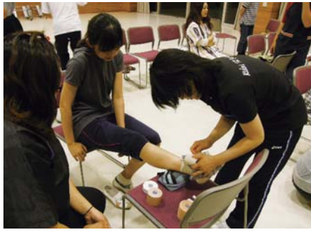
テーピングに挑戦する受講生ら

参加者は、消防職員による救命蘇生訓練「心肺蘇生法」・「AEDの使用方法」や、病院職員による障害予防・対策訓練「アイシング(RICE)処置」・「テーピング」を学んだ。