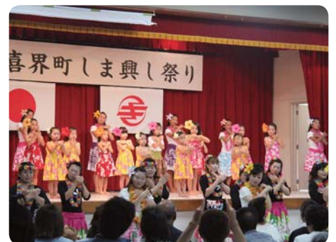
会場一体となったフラダンス