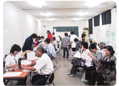
体脂肪測定などの健康チェック