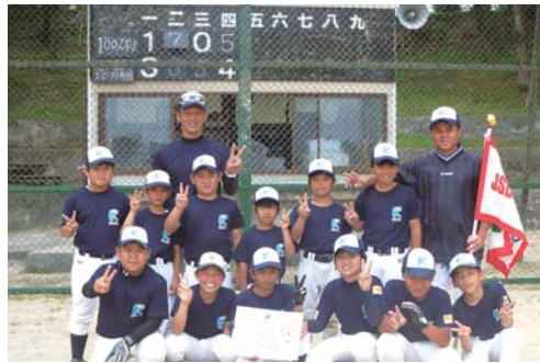
勝利したきかい 100 ナイン