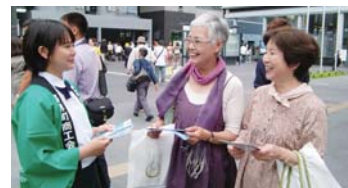
喜界島のPRをする生徒

「はっぴ伝達式」で受け取ったのぼり1本・はっぴ24枚(喜界町商工会・喜界島観光物産協会提供)、「きかいじま」パンフレット600部(役場企画課提供)を持って、京都駅周辺において通行人に喜界島をPRした。