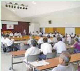
交流会には約60名の関係者が集まり、活発な発表がなされました。

昨年11月に第16回喜界町生涯学習推進大会を開催しましたが、そこで決定した第1～6分科会の実践事項は着実に実践していかねばなりません。大会を開催したその二日がメインではなく、実践事項はこれからの2年間の取り組みであります。また、隔年開催ということもあり、意識を持続させる、中だるみを防ぐということもこの交流会の目的であります。