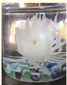
焼酎漬けにした花

月下美人はサボテン科の着生植物。中南米が原産。下部の茎は木質、上部の茎は葉状でよく分枝し、高さ3メートルにまで達する。夏の夜、長さ30センチメートルほどの白色漏斗状の花が咲く。花は芳香を放ち、数時間でしぼむ。