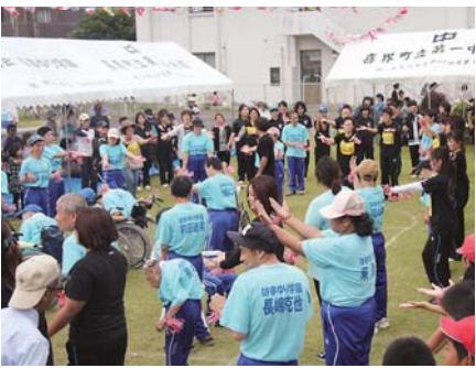
会場一体となり踊る園生と参加者ら

はまゆり学園は昭和50年、「手をつなぐ親の会」として発足。その後、平成元年に現在の名称となる。平成4年社会福祉法人化。平成14年移転、入所者受入を開始する。