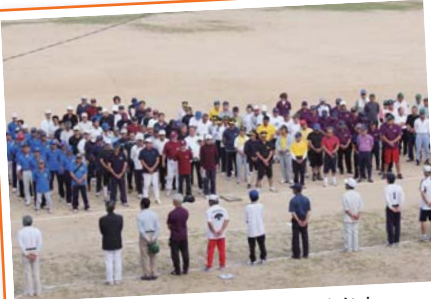
今年も多くのチームが参加