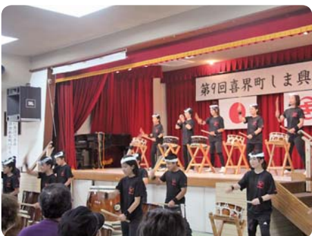
勇壮な喜界島太鼓の響き