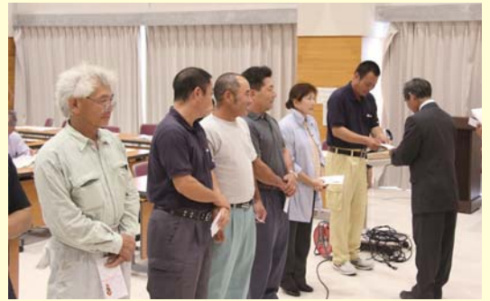
表彰される農家ら