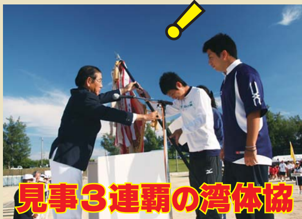
見事3連覇の湾体協