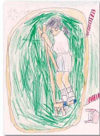
2年 春日 未優