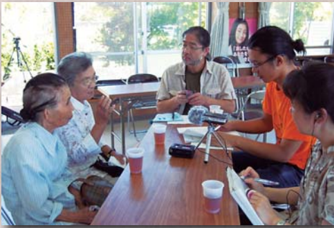
荒木での調査の様子

喜界島とは、これからも長いおつきあいになると思います。今後とも、どうぞよろしくお願いします。