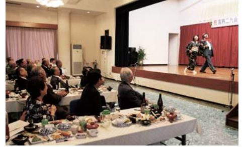
同窓生演じる貫一、お宮に歓声

ん（川嶺）の乾杯で幕を開け、同窓生による舞踊や寸劇、愛島盛蔵とブルーコーラルの歌謡ショー、先日東京であった全国民謡民舞大会で