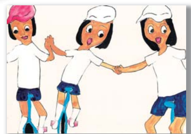
4年 竹下 明希