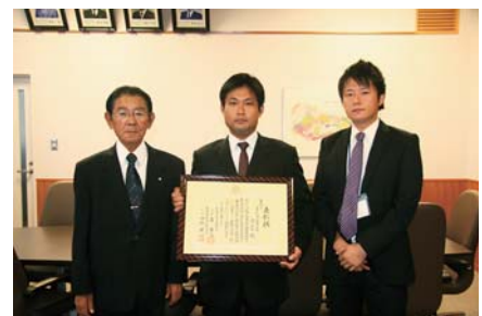
町長に入賞を報告する光さん（中）

光さんは「発行に取り組んだプレミアム商品券や島外から妻を迎えた自身の経験を元に島外出身女性と町商工会青年部員との交流会を実施したことなどを発表した」と話し「1位になれなかったのは残念だが、自分の想いを十分に伝えられたので満足。もっと奄美や喜界島を知ってもらい、遊びに来てもらえるよう青年部活動にも頑張りたい」と決意を新たにされた。