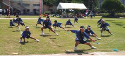
ソーラン節(小野津小学校)

また、どの小学校の運動会でも中学校の生徒が、積極的に母校の運動会に参加したり役員として手伝ったりする姿に後輩を思いやる