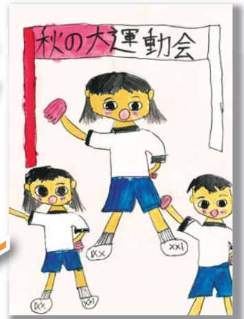
3年 酒井 杏実