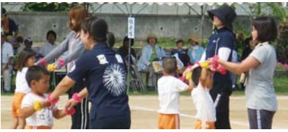
保護者と一緒にダンス(志戸桶幼稚園)

小学校では、創意工夫あふれる団体種目や応援合戦、地域の特性を生かした競技が見られました。どの学校も子どもが主役の素晴らしい演技が披露されました。