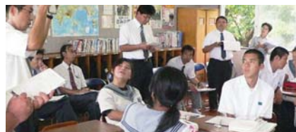
社会科研究授業(早町中学校)