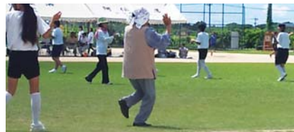
地域の方と一緒に八月踊り(早町中学校)

中学校では、生徒が主体的に動き、体育祭の運営に携わっていました。特にどの学校も応援団による演舞は、素晴らしく、大きな感動を与えてくれました。