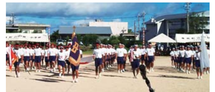
規律ある入場行進(第一中学校)