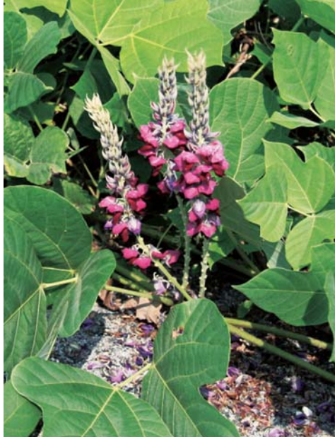
絡まらずにアスファルトを這うクズ