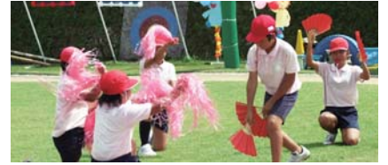
初めての応援団!(滝川小学校)

また、どの小学校の運動会でも中学校の生徒が、積極的に母校の運動会に参加したり役員として手伝ったりする姿に後輩を思いやる