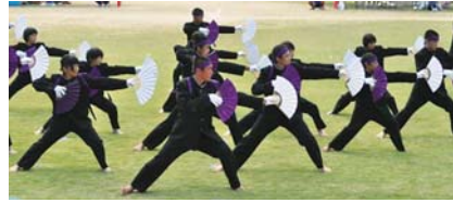
心ひとつの応援団演舞(第二中学校)