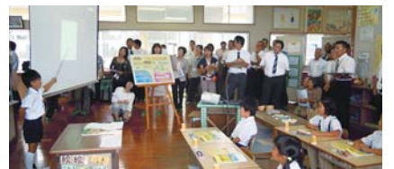
友達に説明する2年生(阿伝小学校)