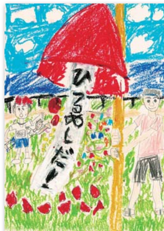
2年 保科 果南