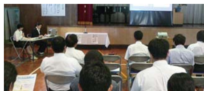
研究発表(早町中学校)

今回の二校による研究発表会は喜界町の子どもの学力向上に向けて実りの多いものとなりました。