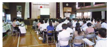
百名以上参加の講演(阿伝小学校)

的に自分の考えを説明したり、友達の意見と比べながら発表したりしていました。総合的な学習の時間の授業では、役場の産業振興課の方や中央公民館の方を講師に喜界島のよさを伝えるパンフレット作りを行うことができました。