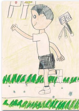
2年 酒井 拓人