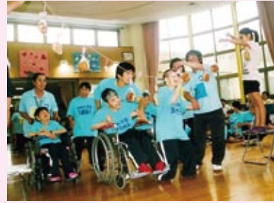
逃げるパンに悪戦苦闘

利用者は町の夏まつりでもこの勢いをそのままに、熱いダンスを披露する予定だ。での六調で大団円。