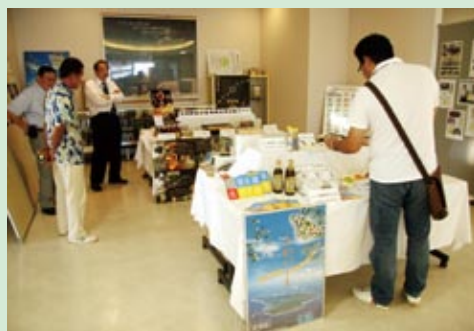
各地区の特産品展示もあった

財政面で誘致を敬遠する町村が多い中、喜界町で開催した意義は大きく、学んだことを今後に活かしたい。女性部でミニバレーボール大会をして、町内外の会員相互の結束も図れた」と振り返った。