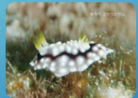
キカモヨウウミウシ