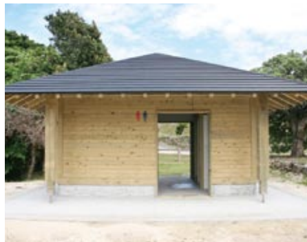
新しくなった公衆トイレ

遊歩道にトイレなど完成 『夕陽の散歩道』の別名を持つ荒木中里遊歩道の休憩所（タンニヤミ展望所そば）にこのほど、トイレと東屋（あずまや）が完成した。トイレは以前から設置されていたが老朽化が進み、使用に支障を来していたため建て替えた。また、東屋は利用者の休憩所や日除けとして設置されたもの。