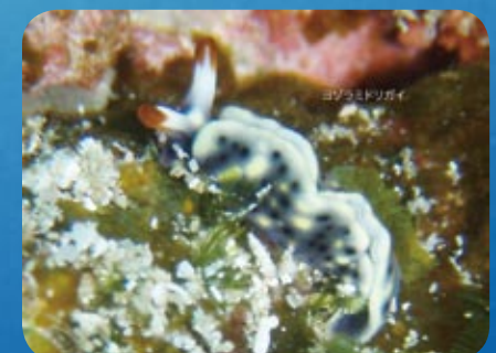
ヨゾラミドリガイ