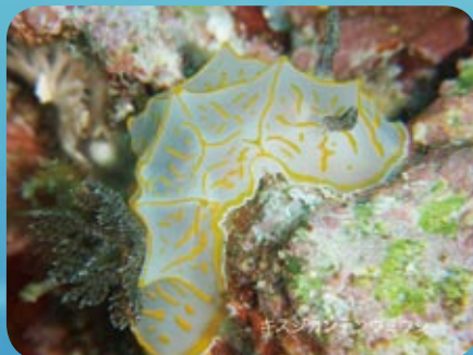
キスジカンテンウミウシ