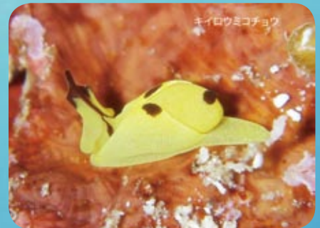
キイロウミコチョウ