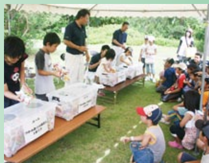
お菓子のつかみ取り「いっぱいとれた」