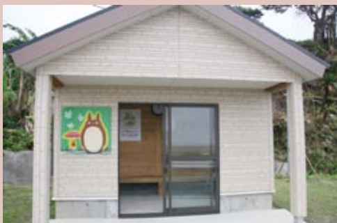
ネコバスは子どもにしか見えません