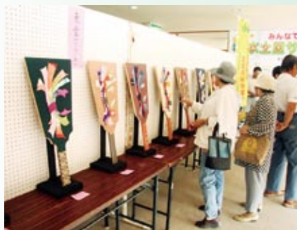
ロビーにも所狭しと各種団体が展示