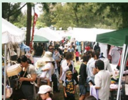
多くの客でごったがえしたフリーマーケット