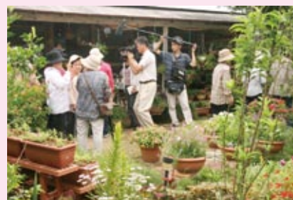
MBC がテレビ取材に訪れた

参加者らは行く先々で、花や防風林、築山、石やサンゴを利用した花壇など、それぞれアイデア満点に工夫された庭造りを見て歩き「〇〇さんヌヤンメーヤ、メーカー、ミリブサタスジャガ」「ウンヒーヤ、シマディーヌムンカイ。ミンダサーヌカ」「ウンヤーヌ、ツッチャマー、ケンブツジャソー。マニシランバ」などと話し合いながら、熱心に見学していた。