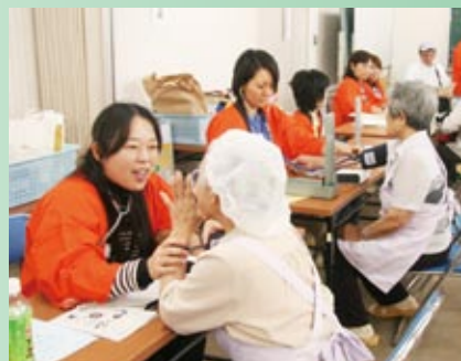
健康相談や脳年齢テスト 体脂肪測定には一喜一憂