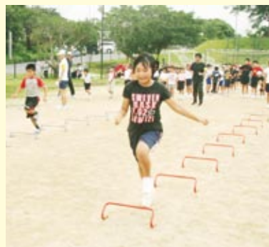
ミニハードルでフォームづくり

「短距離走の基本的フォームづくり」「個人で取り組める練習方法」をテーマに、第1回かけっこ教室（町陸上協会主催）が6月19日、総合グラウンドであった。まず、オニごっこで体を温めて、腕ふりやもも上げ、短距離走に必要なリズム感をやしなうためのスキップで準備運動。次に、地面に置いたラダー（縄ばしご）やミニハードルの上を飛び跳ねるなど色々なパターンで移動し、理想的なフォームを身に付ける練習をした。