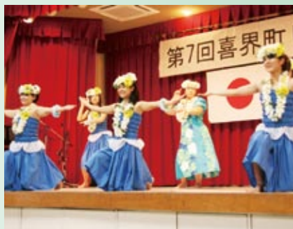
高校生メンバーがほとんど目指せ！フラダンス甲子園