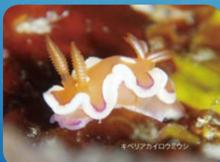
キベリアカイロウミウシ