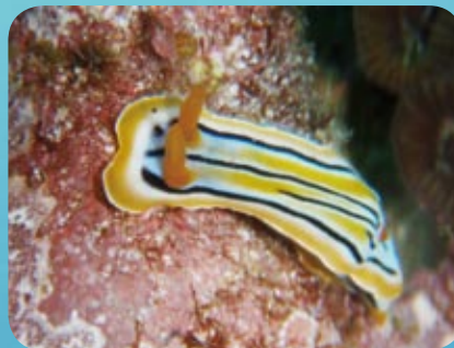
コールマンウミウシ