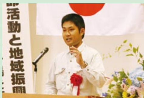
熱く主張する光さん

財政面で誘致を敬遠する町村が多い中、喜界町で開催した意義は大きく、学んだことを今後に活かしたい。女性部でミニバレーボール大会をして、町内外の会員相互の結束も図れた」と振り返った。