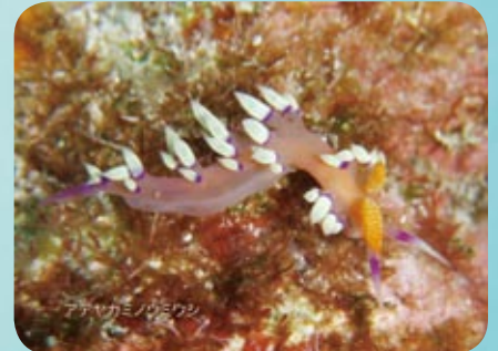
アデヤカミノウミウシ