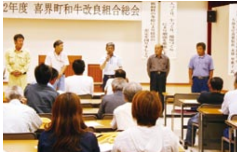
新たに選任された役員ら(中央が宝組合長)