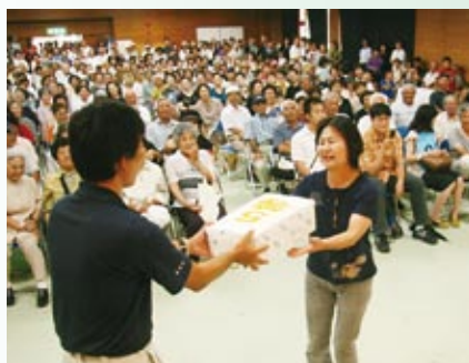
やっぱり目当ては「おたのしみ抽選会」