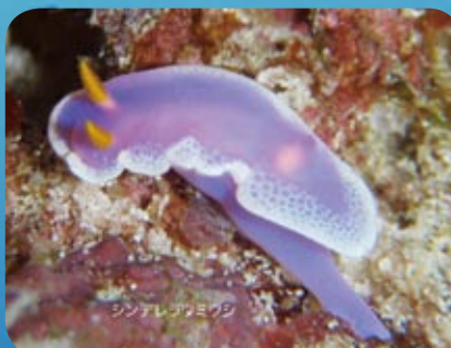
シンデレラウミウシ