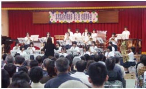
多くの聴衆で埋まった会場