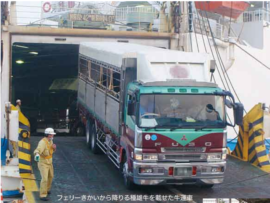
フェリーきかいから降りる種雄牛を載せた牛運車