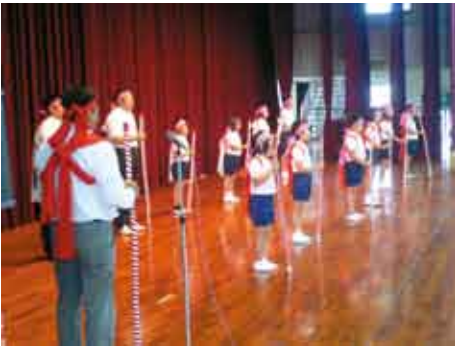
滝川卓球SPによる勇壮な島中踊り

総合開会式では、全てのスポーツ少年団による伝統芸能の発表が行われました。これは、七つの活動領域の一つである文化活動を充実させようと実施したもので、参加者はスポーツ活動の合間に練習を重ね、各団とも特