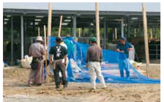
急ピッチで受け入れ態勢を整えた

今回の6頭のうち「金幸福（かねゆきふく）」と「土龍波（どろんぱ）」の2頭は、5月の町子牛セリ市（口蹄疫の影響で延期）で出される予定だった187頭の仔牛の父として大半を占め、まさに「かごしま黒牛」ブランドの屋台骨を支えるスーパーエースである。他の牛も次世代を担うと大きく期待されている。喜界島が移転先として選ばれた理由を県畜産課は「発生地から離れており、なおかつ海で隔てられている。また、口蹄疫以