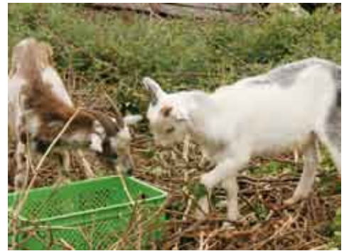
牛や豚だけでなくヤギも要注意