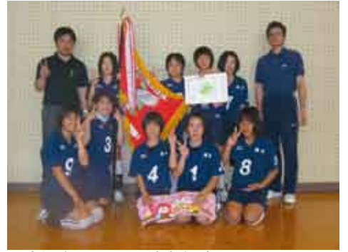
見事優勝を果たした湾少女バレーSPの選手たち