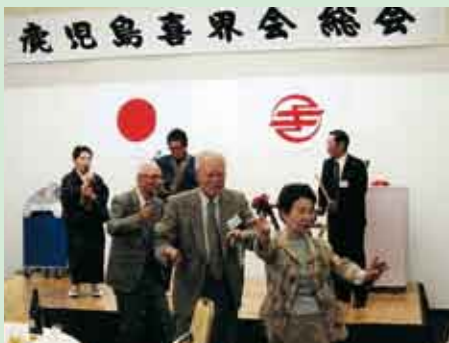
総会後は輪になって八月踊り