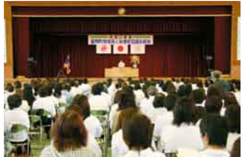
今年度の事業計画などが決定された

す。これらをいかに実践するか、足元の課題をみつめ、女性ならではの視線で安心安全な地域をつくるために、各会員の取組を期待します」とあいさつした。