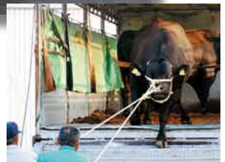
初めての船旅にお疲れぞみ