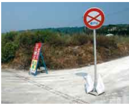
周辺の町道は関係者以外通行止め

現在、種雄牛らは獣医師や県職員らにより24時間体制で管理されており、町当局では「当該畜舎への接近はご遠慮願いたい」と呼びかけている。