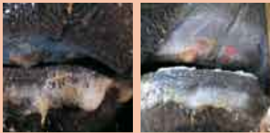
口や蹄（ヒヅメ）に水疱や裂傷ができ、ただれることから口蹄疫の名が付いた