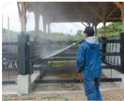
本町でもさっそく防除に取り掛かった