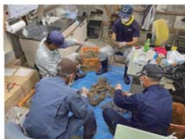
写真3 切開調査中の防除員