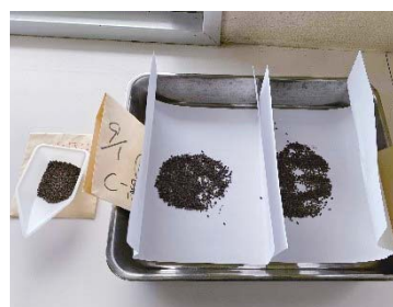
図2…黒いゴマのゴマが生じるものもありました。（図2・3）

令和6年度は、島内生産者・役場・JAが保有する白ゴマを農産物加工センターで洗浄・選別し、色・大きさのよい「A品」を種として1-30系統（株）を鹿児島県農業開発総合センター徳之島支場で栽培しました。