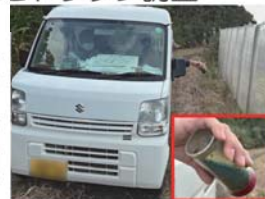
写真6 アリモドキコール粒剤散布

アリモドキゾウムシを誘引するフェロモンと殺虫成分を含む誘殺剤を毎月ノアサガオ群落付近の道路沿いに散布しています（写真6）。防除効果を確認するため、トラップ調査も行っています。