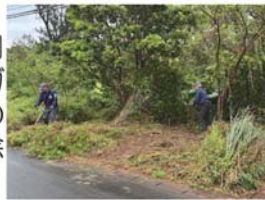
写真1 ノアサガオ群落除去作業中

畑や遊休地、民家等の周辺に自生しているノアサガオを見つけ出し、地権者等の同意をもらって、つるの除去・回収を行っています（写真1）。除去したつる（写真2）は、束ねて