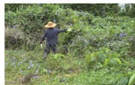
写真4 不妊虫放飼（手撒き）

次世代の野生虫数を減らしていくために、不妊虫を2月下旬～11月中旬まで指定したエリアのノアサガオ群落に防除員による手撒きやドローンにより放飼を行っています（写真4、5）。