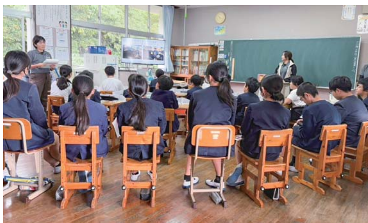
食育出前授業「お肉が食卓に上がるまで」

町農業振興課担当者によると、「今後もワークショップや食育活動を通じて、交流の輪を広げていく予定。新規加入者を募集しているので、興味を持つている女性農家は、気軽に農業振興課（☎65-3692）へ問い合わせていただきたい」と話している。