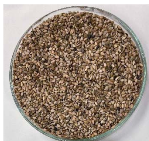
図1：出荷されたゴマ（A品率が低い）