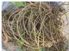
写真2 除去したノアサガオのつる

ビニル袋に入れて毎週月曜日に奄美の特殊病害虫係に送り、切開調査によりつる内の寄生虫を調べています（写真3）。防除員達でも切開調査を行い、防除状況（成果）を把握しながら作業を進めています。