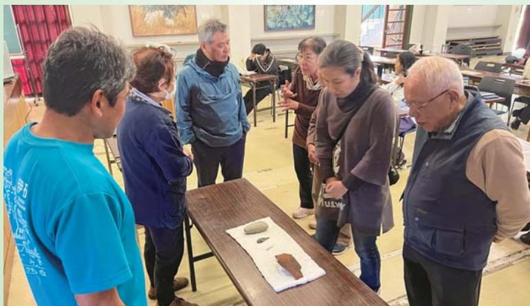
出土した石器や土器を囲み、講師の説明を聞きながら観察

遺跡に匹敵する規模の遺跡として、鉄器やネコの出土など新たな見どころが紹介されました。