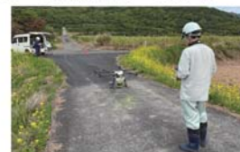
写真5 不妊虫放飼（ドローン）