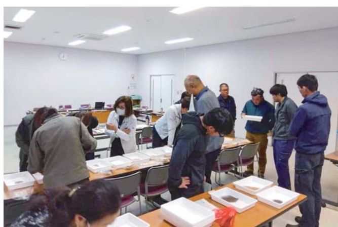
協議会員での検討