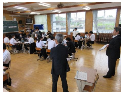
5月 大島教育事務所訪問