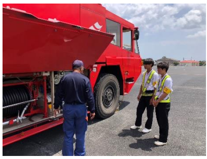
5月 職場体験学習（3年生）