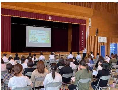
5月 PTA 総会