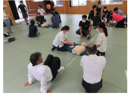
(3)家庭教育学級 (A E D講習)